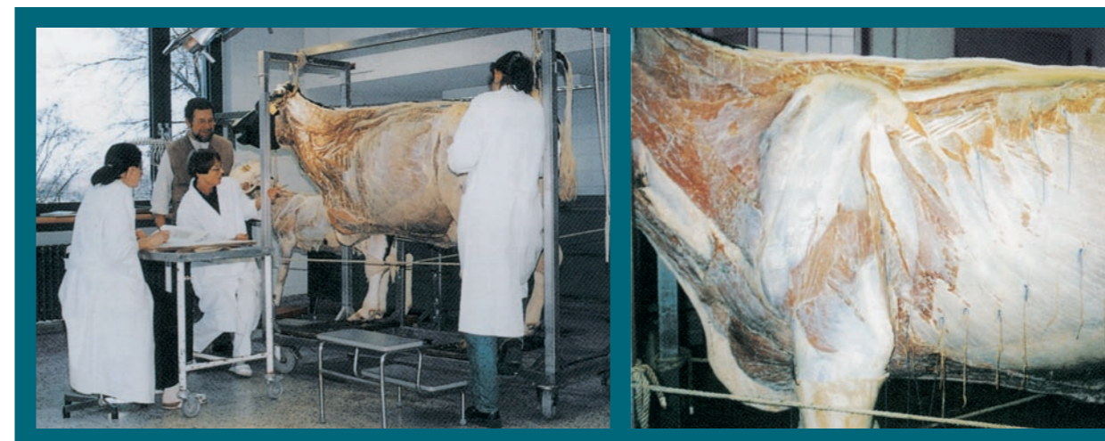
Einmalig: Muskel für Muskel wird entblättert, jede Struktur wird mit dem Zeichenstift dokumentiert. Auf diese Weise entstanden alle Abbildungstafeln der Atlanten – mit Akribie und Originalität.